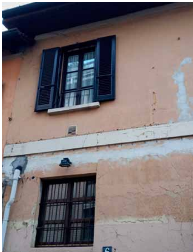
Vecchi serramenti di Via Dalmine 6